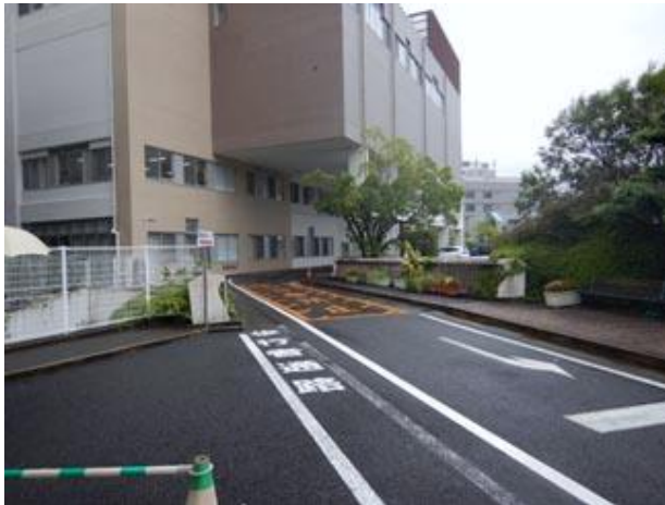
②建物手前を通り奥に進む